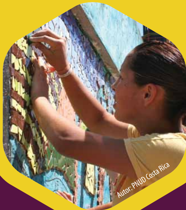
Autor: PNUD Costa Rica